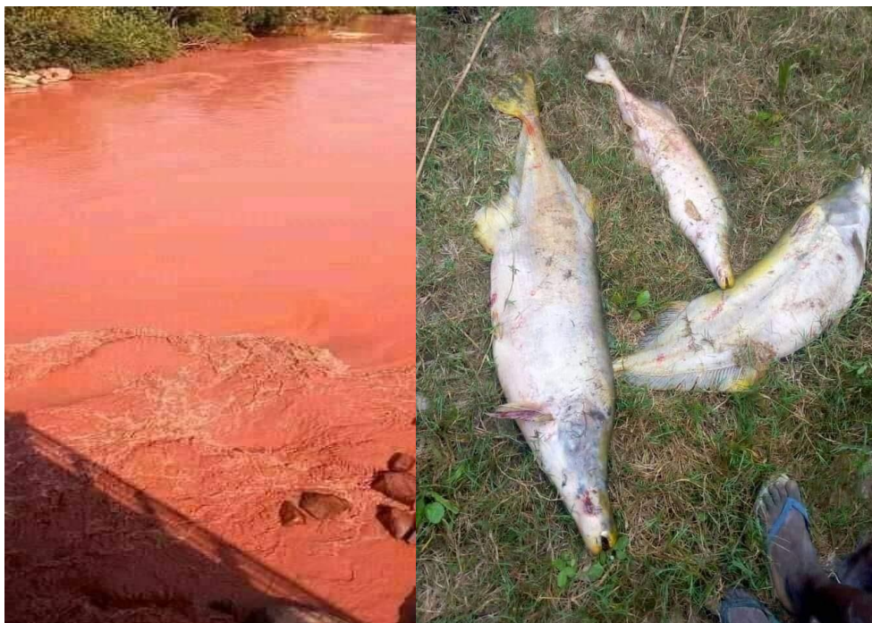
Fig. 2 Effets immédiats de la pollution des rivières Tshikapa et Kasai en RD Congo

Les conséquences préliminaires enregistrées comprennent la pollution des eaux, l'intoxication et la perte de la faune et la flore aquatique, les maladies d'origine hydrique pour les populations riveraines, la perturbation des activités de pêches et de navigation, et le manque d'accès aux services d'eau à usage domestique et de récréation.