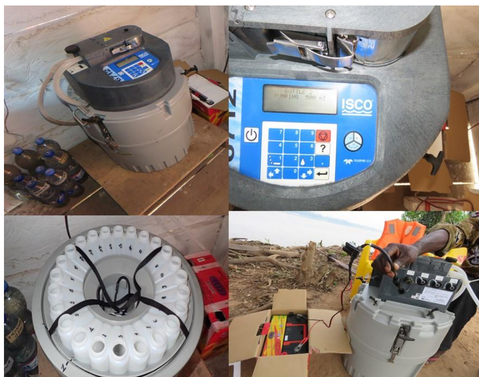
Fig. 5 Quelques équipements de la station de surveillance des flux sur la rivière Kasaï

Depuis 2017, CRREBaC assure la surveillance des flux hydrologiques (qualité et quantité de l'eau) à partir de sa station installée sur la rivière Kasaï à Kutmumuke, dont le prélèvement automatique des échantillons de la rivière se fait 24h sur 24h. C'est l'unique station complète sur la rivière Kasaï qui peut être utilisée à ce jour pour évaluer la situation avant et après cette tragédie. Ces mesures devront être complétées par d'autres mesures en amont et en aval de la station CRREBaC en vue d'évaluer le niveau du risque. Ceci devrait permettre d'établir les responsabilités et orienter la prise de décision pour la gestion durable des ressources en eau du bassin versant de la rivière Kasaï.