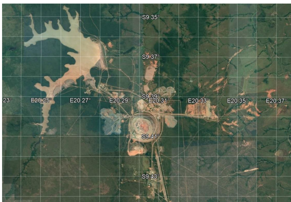
Fig. 1 Localisation de la source de pollution des rivières Tshikapa et Kasai en Angola

Depuis le début du mois d'août 2021, les populations riveraines du bassin de la rivière Kasai, précisément le long des rivières Tshikapa et Kasai, vivent une catastrophe environnementale et humaine d'une ampleur incalculable. Cette catastrophe serait due à la pollution de ces rivières suite aux activités minières en amont du bassin versant de la rivière Tshikapa dans la partie angolaise. Il s'agirait des complexes miniers de Luo, Camatchia-Camagico et Catoca.