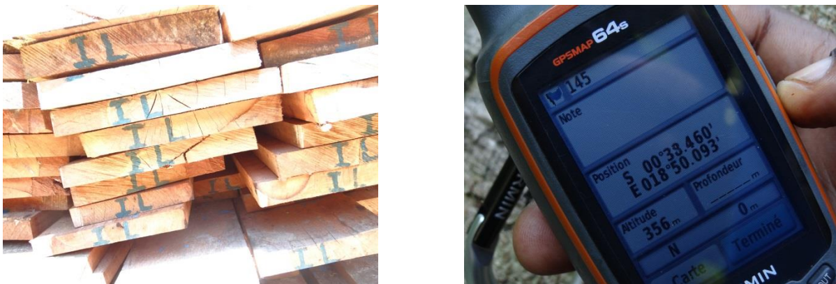
Photo 4. Sciages trouvés dans la concession de BBC

Le jour suivant, l'équipe de la mission est allée dans un autre lieu de cette même concession, dans le secteur de Bokatola, groupement Bombwandja, territoire d'Ingende où elle a constaté le sciage de 515 plateaux de planche soit environ 40 m 3 de kossipo. L'équipe a vu 6 souches de kossipo dont 1 arbre abattu et non scié. Ces planches portaient le sigle IL faits à la peinture (photo 6).