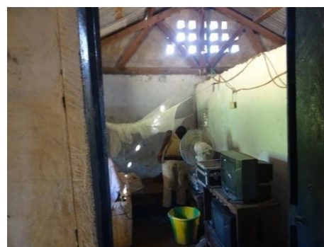
Photo 2. Installation sanitaire et centre de santé non conformes dans la base-vie du chantier de Baulu