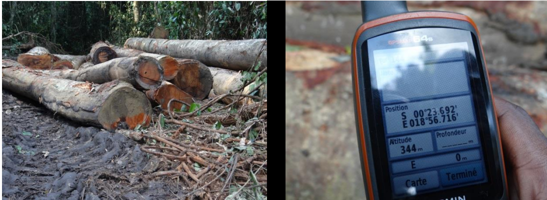
Photo 3. Diverses essences coupées dans la concession forestière de BBC

Il ressort des observations des traces sur terrain qu'il s'agit d'une coupe récente. Les grumes ont été ensuite débardées avec du matériel roulant. Pour masquer son action, l'auteur a ramené les grumes de la route principale à environ 10 m dans la forêt et recouvert du feuillage les traces du passage de la machine de l'endroit où étaient entreposées les grumes. L'équipe voulait poursuivre la recherche sur d'autres sites dans la concession mais elle a été malheureusement arrêtée par une violente pluie.